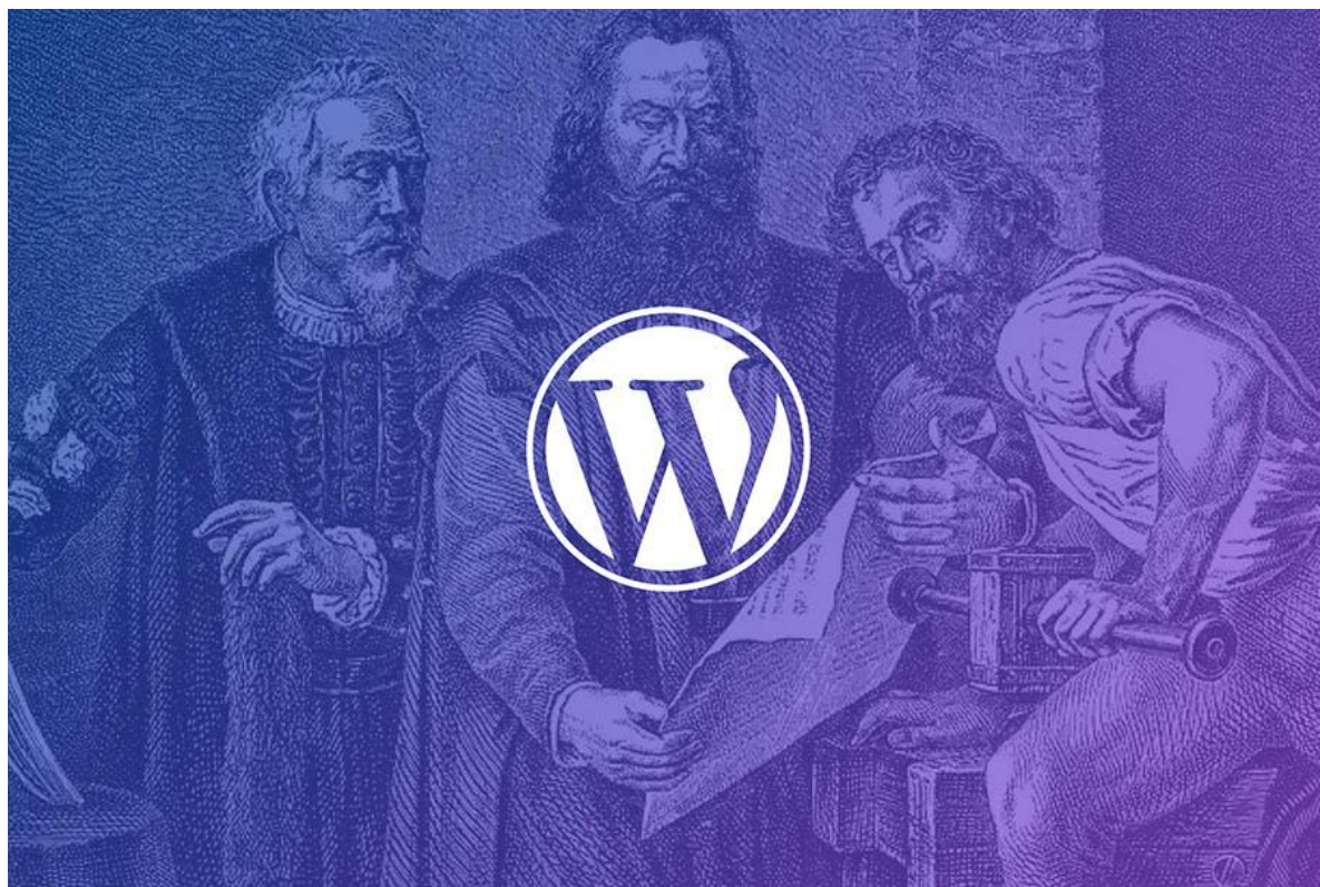
معرفی گوتنبرگ ویرایشگر جدید وردپرس و نحوه کار با آن

چنان چه ستون سمت چپ را مشاهده نکردید، می توانید از طریق علامت چرخ دنده که در بالای صفحه قرار دارد، به آن دسترسی پیدا کنید.