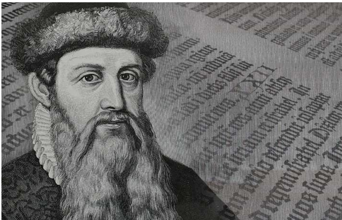
معرفی گوتنبرگ ویرایشگر جدید وردپرس و نحوه کار با آن

گوتنبرگ (Gutenberg) یک ویرایشگر جدید برای وردپرس است، که به صورت یک افزونه به نسخه ۴,۹,۸ وردپرس اضافه شده است، البته قرار است در نسخه ۵ وردپرس به هسته آن اضافه گردد. این افزونه ویرایشگر به نام یوهانس گوتنبرگ کسی که ۵۰۰ سال قبل ماشین چاپ را اختراع کرد، نام گذاری شده است.